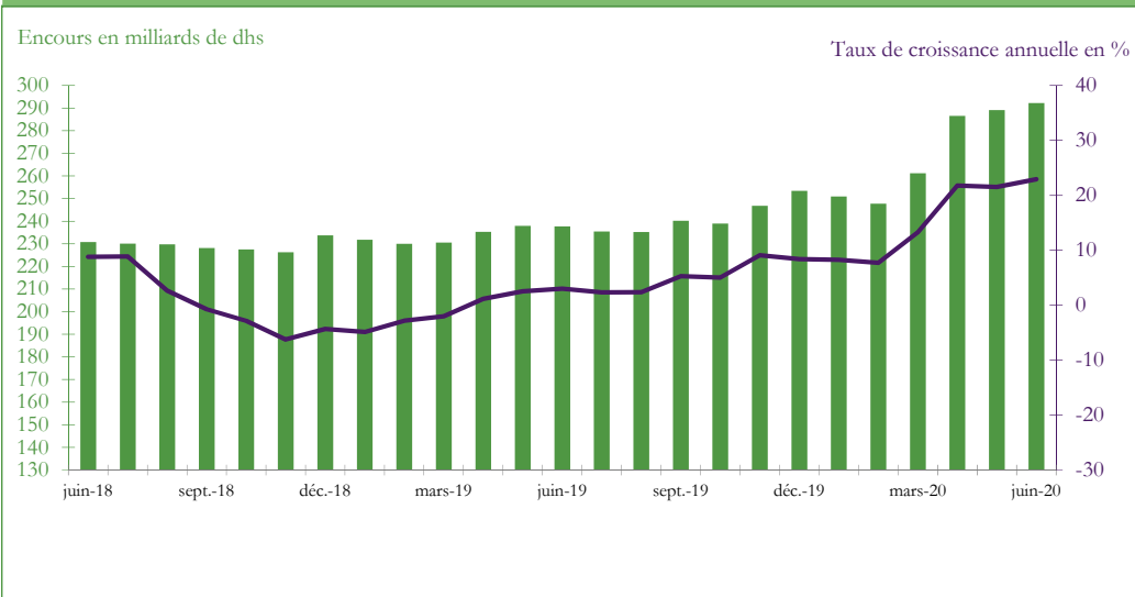
Graphique 3 : EVOLUTION DES AVOIRS OFFICIELS DE RESERVE